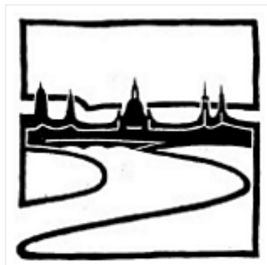
eine Pressemitteilung von Dresdens Erben

Unter dem Punkt „Umbau Kulturpalast“ sollen laut Entwurf jährlich etwa 4,2 Mio. Euro im Haushalt eingestellt werden. Für die Folgejahre ab 2013 sind die Summen noch höher aufgrund der dann beginnenden Umbaumaßnahmen.